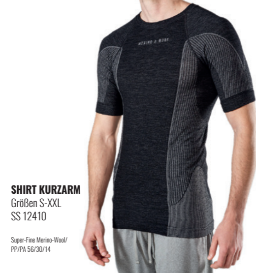
SHIRT KURZARM Größen S-XXL SS 12410