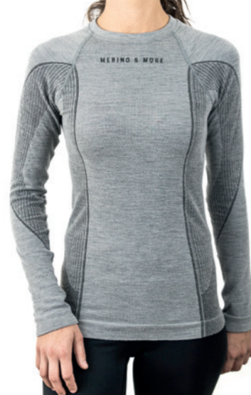
SHIRT LANGARM Größen S-XL LS 14260