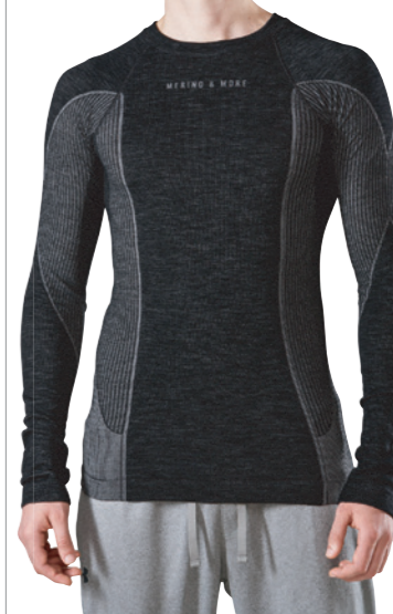
SHIRT LANGARM Größen S-XL LS 13630