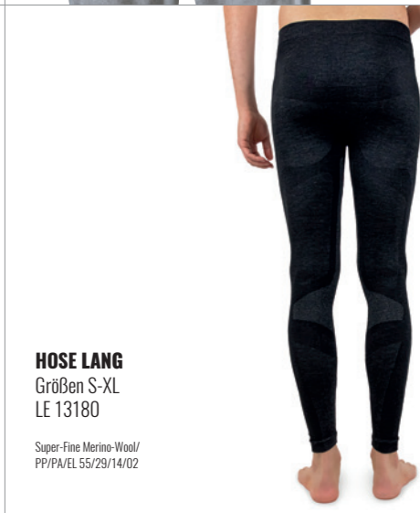
HOSE LANG Größen S-XL LE 13180

Super-Fine Merino-Wool/ PP/PA/EL 55/29/14/02