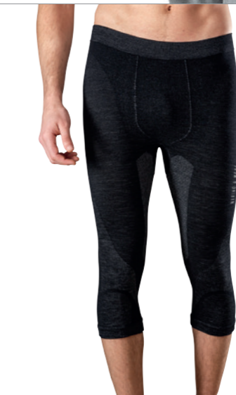
HOSE ¾ Größen S-XL SP 10520

Die Wolle des Merinoschafs genießt weltweit Kultstatus bei Outdoor-Sportlern – aufgrund ihrer erstaunlichen wärme- und feuchtigkeitsregulierenden Eigenschaften, ihres Tragekomforts und ihrer geruchsneutralisierenden Wirkung. Als Außenschicht der Wäsche nimmt dieses natürliche Wundermaterial die Feuchtigkeit aus der Polypropylen-Schicht auf und lässt sie verdunsten.