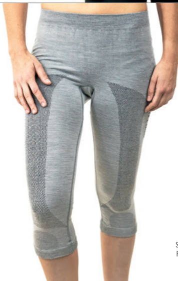
HOSE ¾ Größen S-XL SP 10560

Super-Fine Merino-Wool/ PP/PA/EL 55/29/14/02