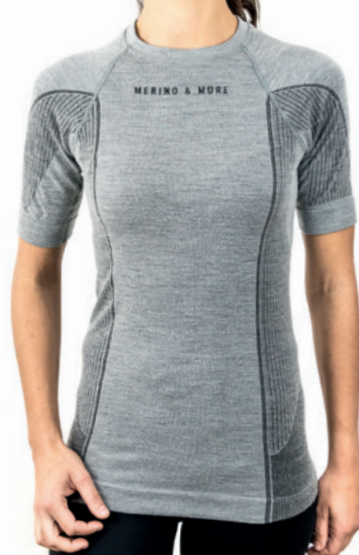
SHIRT KURZARM Größen S-XL SS 13050