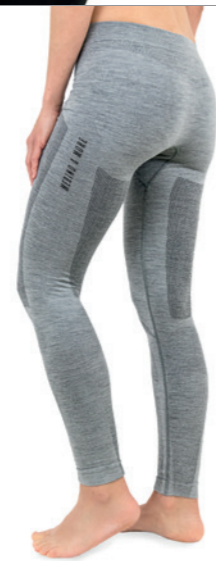
HOSE LANG Größen S-XL LE 13190

Super-Fine Merino-Wool/ PP/PA/EL 55/29/14/02